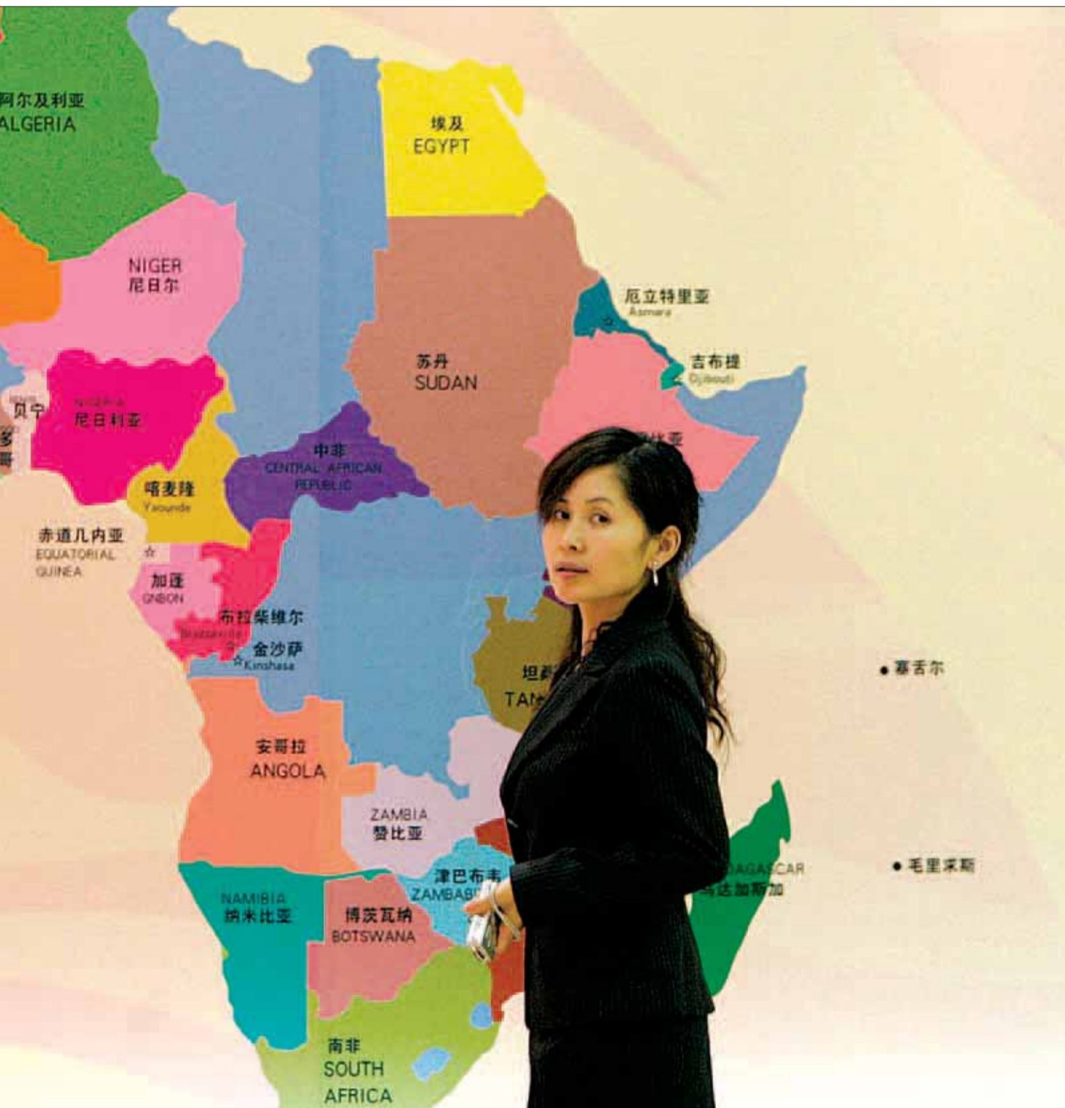
Kinas samhandel med Afrika er mere end fordoblet siden årtusindskiftet. En win-win situation for begge parter?