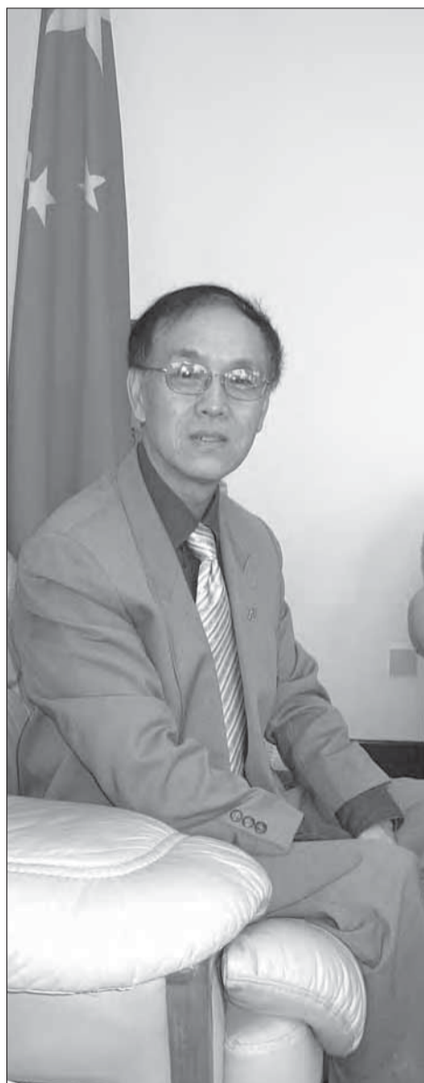
Kinas ambassadør i Ghana Yu Wenzhe siger, at han ikke frygter, at et nyt bjerg af gæld skal ødelægge de afrikanske lande.

Vestlige analytikere spekulerer over, om Kinas lempelige långivning, der utvivlsomt vil komme til at hæmme de afrikanske regerings handlefrihed, er et bevidst træk fra